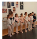
Cours ouverts Danse