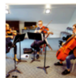
Musique de chambre