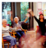
Danse à l'EHPAD