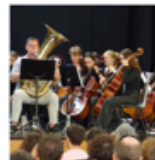
Concert de Noël