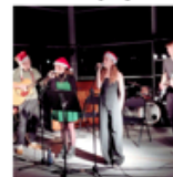
Concert de Noël