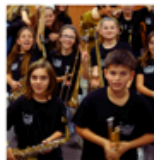
Orchestre à l'école