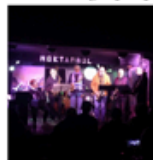
Jazz in Noktambül